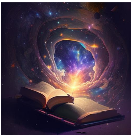
Ответ: космическое исследование