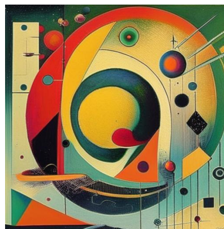
Ответ: Орбитальная станция

После ответов обучающихся учитель рассказывает о Дне космонавтики и о том, что освоение космоса – направление, в котором Россия была и остается первой и переходит к демонстрации видеоприветствия Борисова Юрия Ивановича.