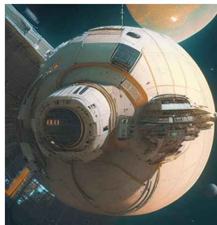
Ответ: Орбитальная станция