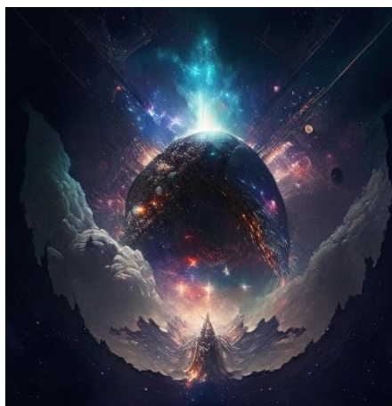
Ответ: Покорение космоса