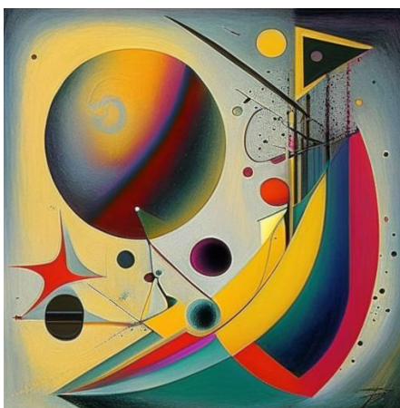
Ответ: космическое исследование

Далее представлены картинки в стиле работ русского художника-авангардиста Василия Васильевича Кандинского.